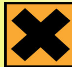
Xn - Nocif

R 40 : Effets cancérogènes suspectés preuves insuffisantes (C3)