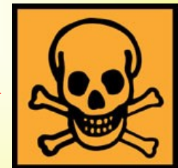
T - Toxique

R 61 : Risque pendant la grossesse d'effets néfastes pour l'enfant (R1 et R2)